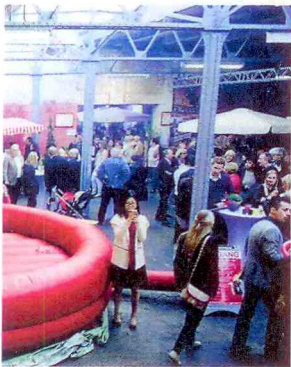
Ein Fest für die ganze Familie: Im Alten Güterbahnhof in Herford wurde extra eine Kirmes aufgebaut