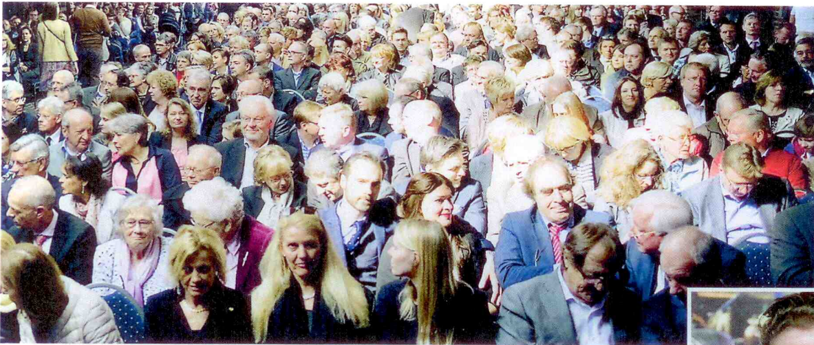
Riesiges Interesse: Die vorbereiteten 900 Plätze reichten zum Schluss nicht, um jedem Gast einen Sitzplatz anzubieten