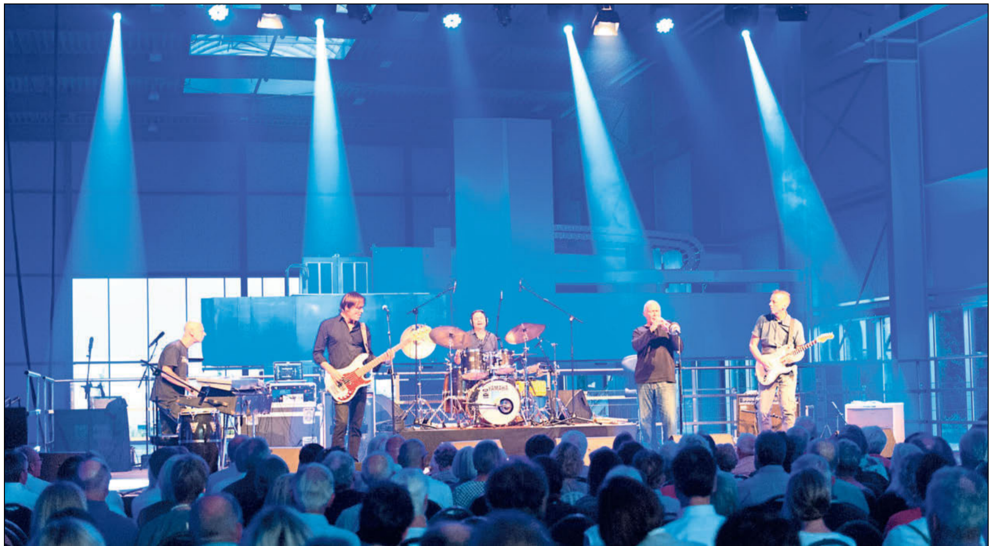
Herausragende Band vor imposanter Kulisse: Die »Nighthawks« spielen Jazz vor einer riesigen Werkzeugteile-Fräse bei Wemhöner.