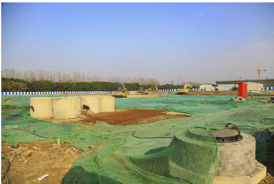
Das Gelände ist abgesteckt, die Bodenarbeiten in vollem Gang.